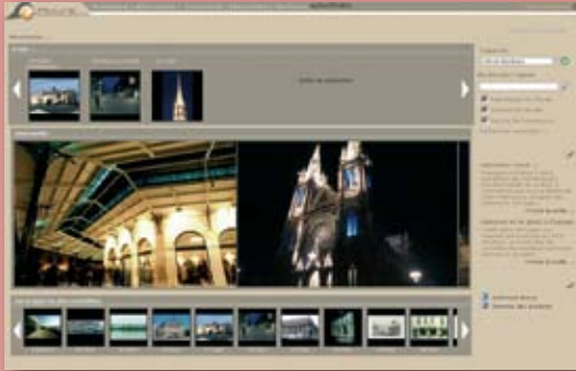
> Vue détaillée des photographies

Picturia est également un portail qui s'adresse aux professionnels pour l'administration des fonds. Picturia propose deux modes de publication des images : à l'unité ou par lot.